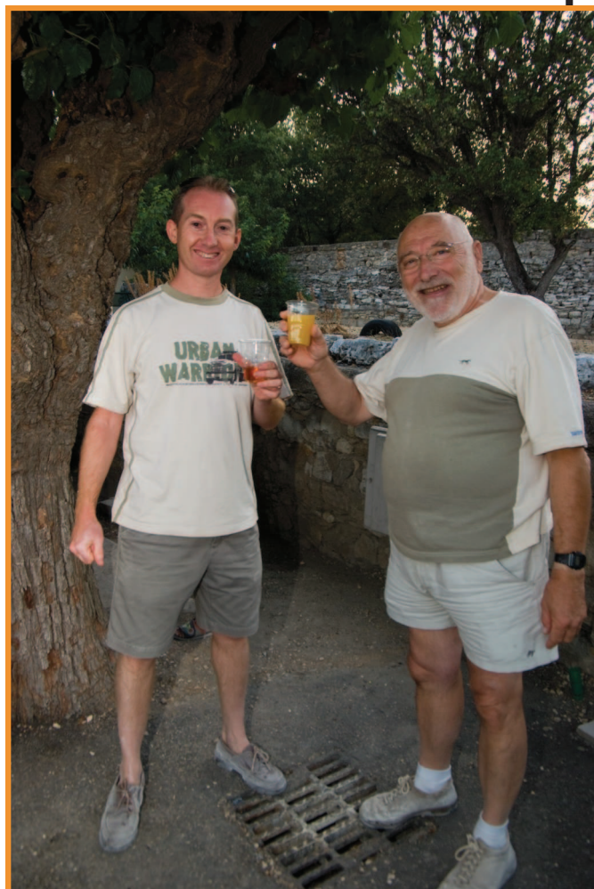
Voilà une photo qui pourrait être présentée au concours photo 2011