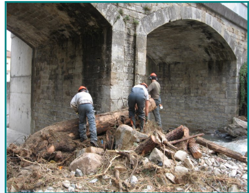
Désembâclement d'un pont sur le Brémo

Aujourd'hui, le SMAGE des Gardons, grâce au travail de son équipe ainsi qu'aux interventions d'entreprises privées, maintient le bon état d'entretien obtenu à ce jour sur notre territoire. Pour cela, il assure une programmation des travaux à réaliser sur l'ensemble du bassin versant des Gardons en fonction des besoins et des enjeux sur les secteurs concernés.